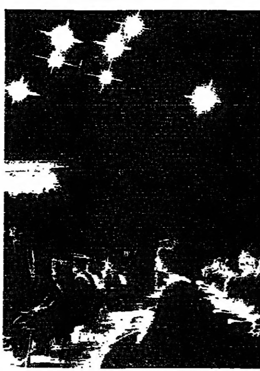
المخرج الاكبر الدكتور البيرت بدر يلقي كلمة